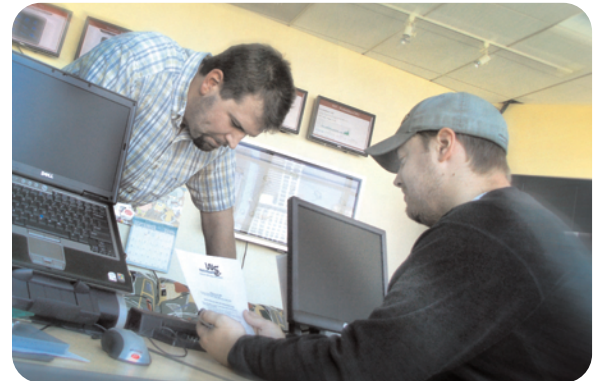
L'équipe LiveSecurity vise un délai de réponse de 4 heures